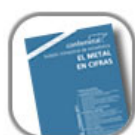
boletín de estadísticas del metal