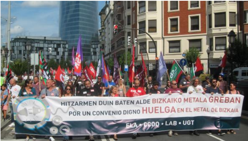
Manifestación de trabajadores del Metal

Tras una pancarta en la que se podía leer 'Por un convenio digno. Huelga en el metal de Bizkaia', la marcha ha arrancado pasadas las 12.15 horas de la Plaza Euskadi entre gritos de 'Borroka da bide bakarra' (la lucha es el único camino).